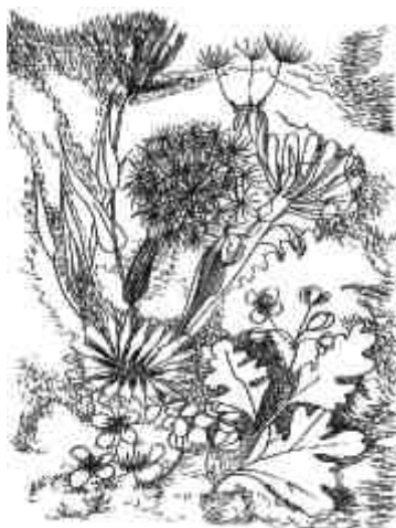
Tavaszi - a szerző alkotása